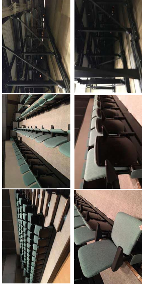
既存移動観覧席写真